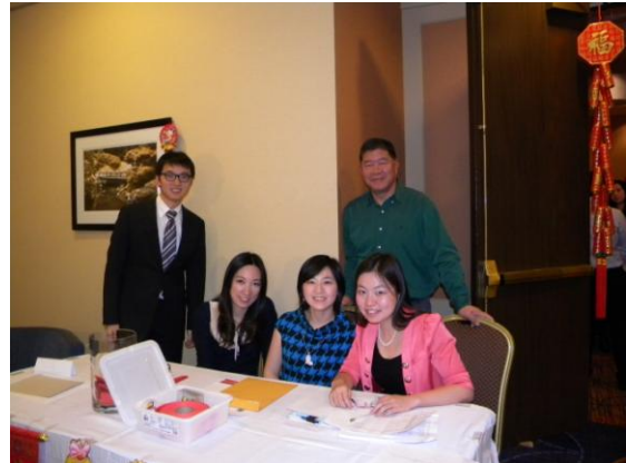
高津宁财务长和接待处的年轻人们。