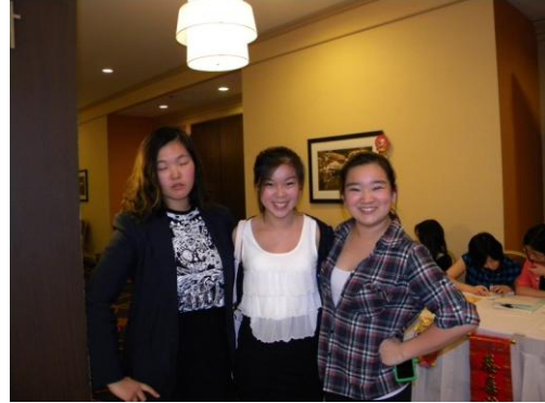
多才多艺的CEO 下一代